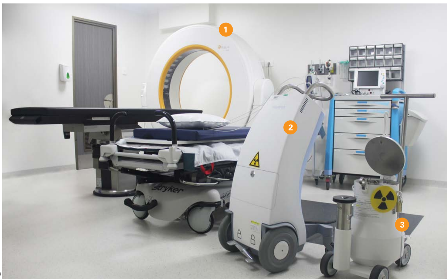
Equipamiento del Servicio de Braquiterapia de FALP: (1) TAC portátil Airo dedicado a braquiterapia. (2) Equipo de braquiterapia Flexitron Cobalt-60. (3) Minibúnker para guardar las fuentes radiactivas.

Según cuenta el especialista, la braquiterapia se ha usado históricamente en el tratamiento de cáncer de próstata: “Ha sido un pilar fundamental dentro del arsenal terapéutico contra el cáncer de próstata, pero lamentablemente ha ido cayendo en desuso en Chile debido a varias razones, siendo las