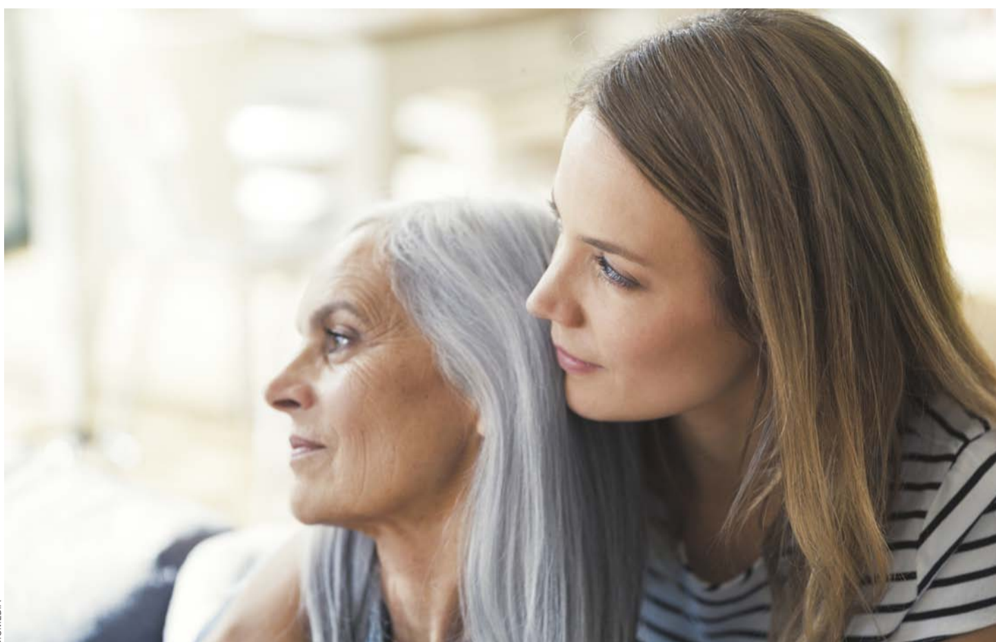
"Las mujeres deben entender que su salud es primordial", comenta el Dr. Chahuán.

Muchas mujeres han postergado este examen, que debe realizarse anualmente, producto de la pandemia. Su importancia radica en que, si se diagnostica a tiempo, esta enfermedad es curable en la gran mayoría de los casos.